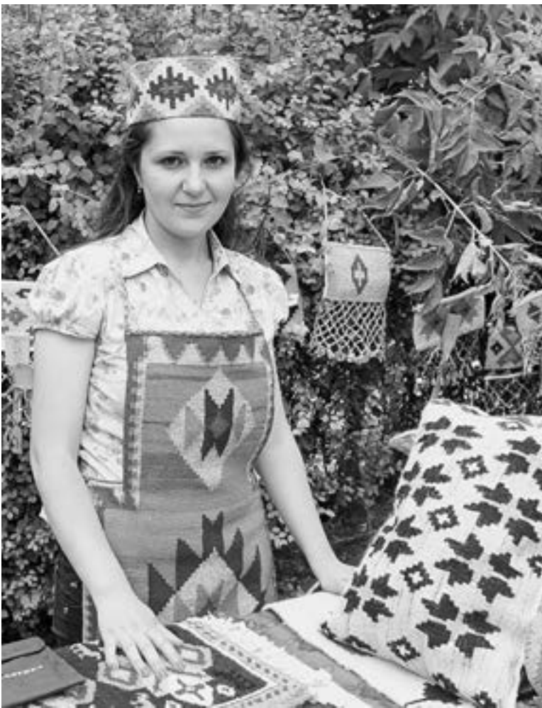
«Միսիանի կանանց ռեսուրս կենտրոնի» փողավարը

Մենք մի շարք կարեւորագույն խնդիրներ ունենք լուծելու, որոնք պետական մարմինների, մասնավոր հատվածի, բնակչության լայն շերտերի շահերից է բխում: Դա այն է, որ պիտի զարգացնենք, ամրապնդենք մեր ավանդույթները, զբոսաշրջությունն ապակենտրոնացնենք դեպի հանրապետության մարզեր, նպաստենք տնտեսության համաչափ զարգացմանը, որ դրանք ավելի զրավիչ ու մրցունակ լինեն միջազ-